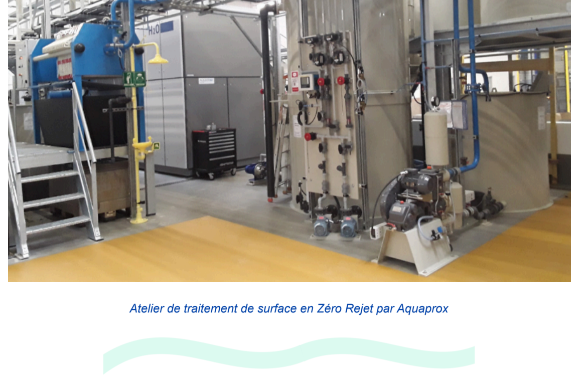
Atelier de traitement de surface en Zero-Rejet par Aquaprox

Traitement des eaux usées : réduisez vos coûts et votre impact environnemental grâce à l'évaporation sous vide ! Découvrez comment l'évaporation sous vide peut transformer la gestion de vos effluents industriels en une opportunité d'économies et de valorisation des ressources grâce à la revue L'Eau l'Industrie les Nuisances .