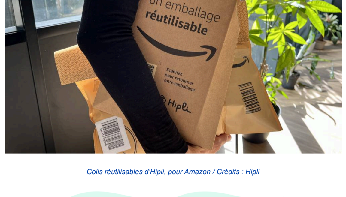
Colis réutilisables d'Hipi, pour Amazon

Face aux enjeux environnementaux, le e-commerce se tourne vers des solutions plus durables. Environnement Magazine met en avant une nouvelle et prometteuse pour rendre nos commandes en ligne plus respectueuses de la planète !