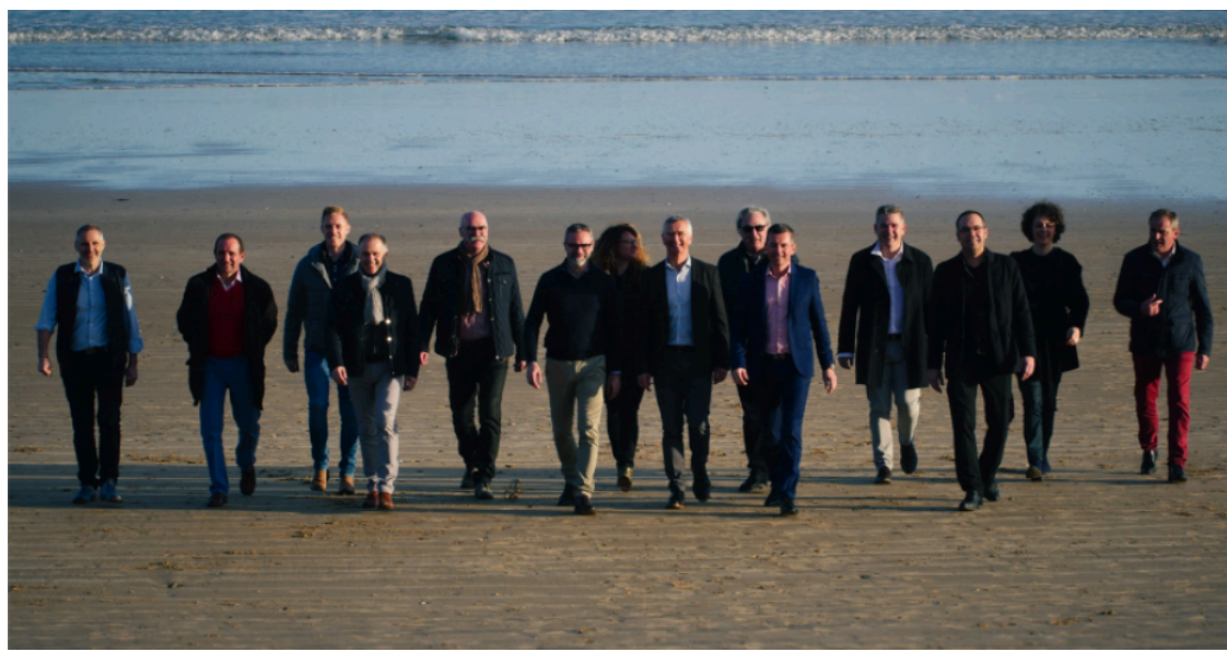
L'association Ruptur a été créée en 2018 par 15 chefs d'entreprise de Vendée et de Loire-Atlantique. Elle compte aujourd'hui plus de 150 membres @Ruptur

Découvrez l'article de l'Informateur Judiciaire où Ruptur , acteur de l'économie bleue, a dévoilé un label novateur destiné à promouvoir les entreprises engagées dans des projets durables et responsables.